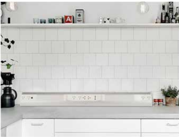
En Bajo y sobre mesadas

El Track puede ser utilizado de muchísimas maneras, entre ellas podemos destacar: