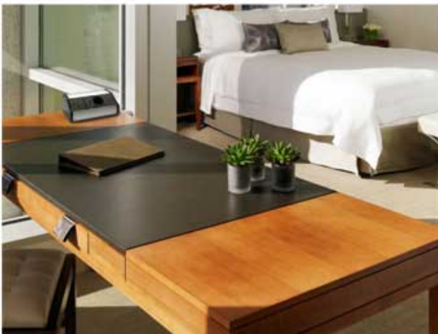
En ESCRITORIOS mesas de luz